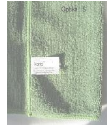
Nanotextília optik veľkosť S

Pri čistení napr. okuliarov a optiky nepoužijete žiadne chemické látky ani čističové voľbec !!!. Nano textília Optik veľkosť S je špeciálne navrhnutá tak, aby optimálne vyčistila povrch bez poškodenia.