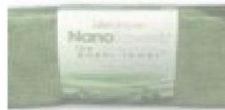
Nano fiber textília

Optika, čisté okuliare bez šmúh a mastnoty, čistý displej, PC? Nano textília vyrobená revolučnou technológiou značne znižujúca spotrebu papierových, resp. iných čistiacich mikro utierok