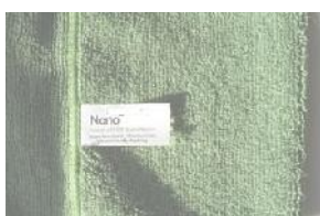
Nanotextília pre domácnosť