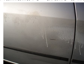
Aplikácia peny nástrekom