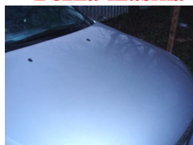
Kapota v zime PRED Kapota v zime PO