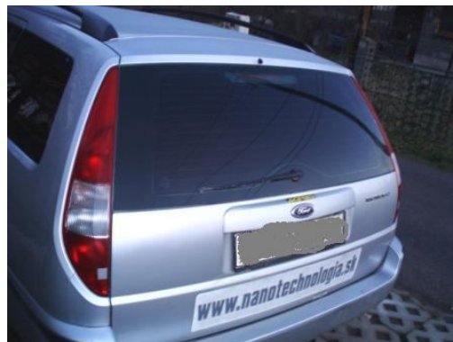
Moja maličkosť v zime- Hotovo! Lets drive !