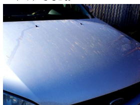
Blato,prach,nečistota . .