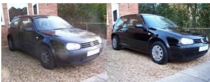
WW golf za cca 15min.( lesk BEZ šmúh, BEZ voskovania )