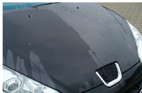
VWgolf s Aktívnou penou NANO ( BEZ pastovania,vosku,silikonu a 2-3 hodinovej PRACE!!! )