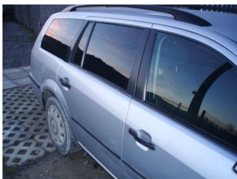
Výsledok za 10-15min. : BEZ voskovania, BEZ pastovania, leštenky a Vašej 2-hodinovej PRACE!!! Bočná časť krok3-Hotovo!