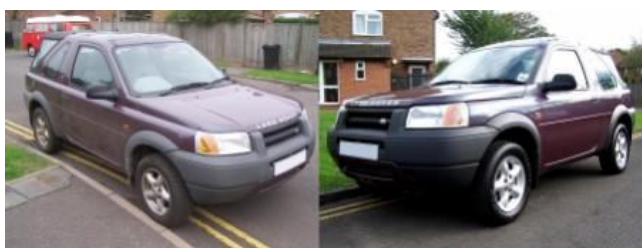
Land rover za cca 15-20 minut.

1,Nastriekať 2,Rozotrieť 3,Doleštiť 4,Hotovo!!! Nano Ochrana BEZ pastovania, voskovania atd